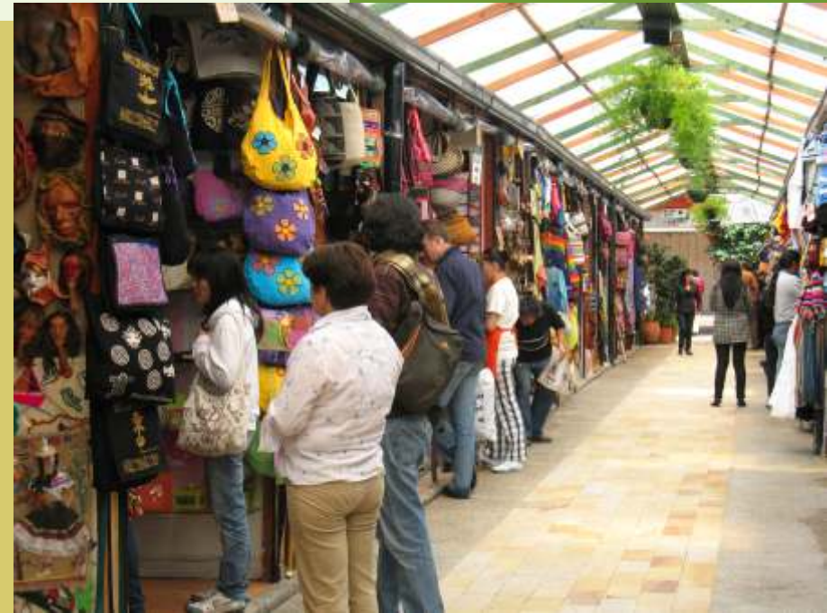
Feria Artesanal - Centro de Bogotá

No. Las acciones y demás valores que emitan las SAS no pueden inscribirse en el Registro Nacional de Valores y Emisores ni negociarse en la Bolsa de Valores.