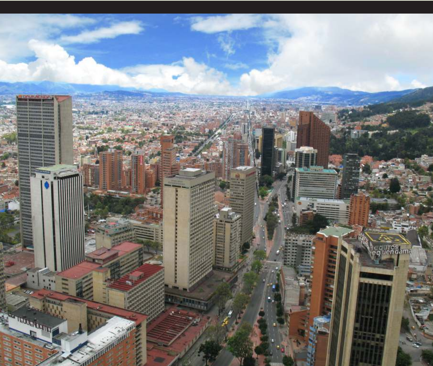
Panorámica de Bogotá