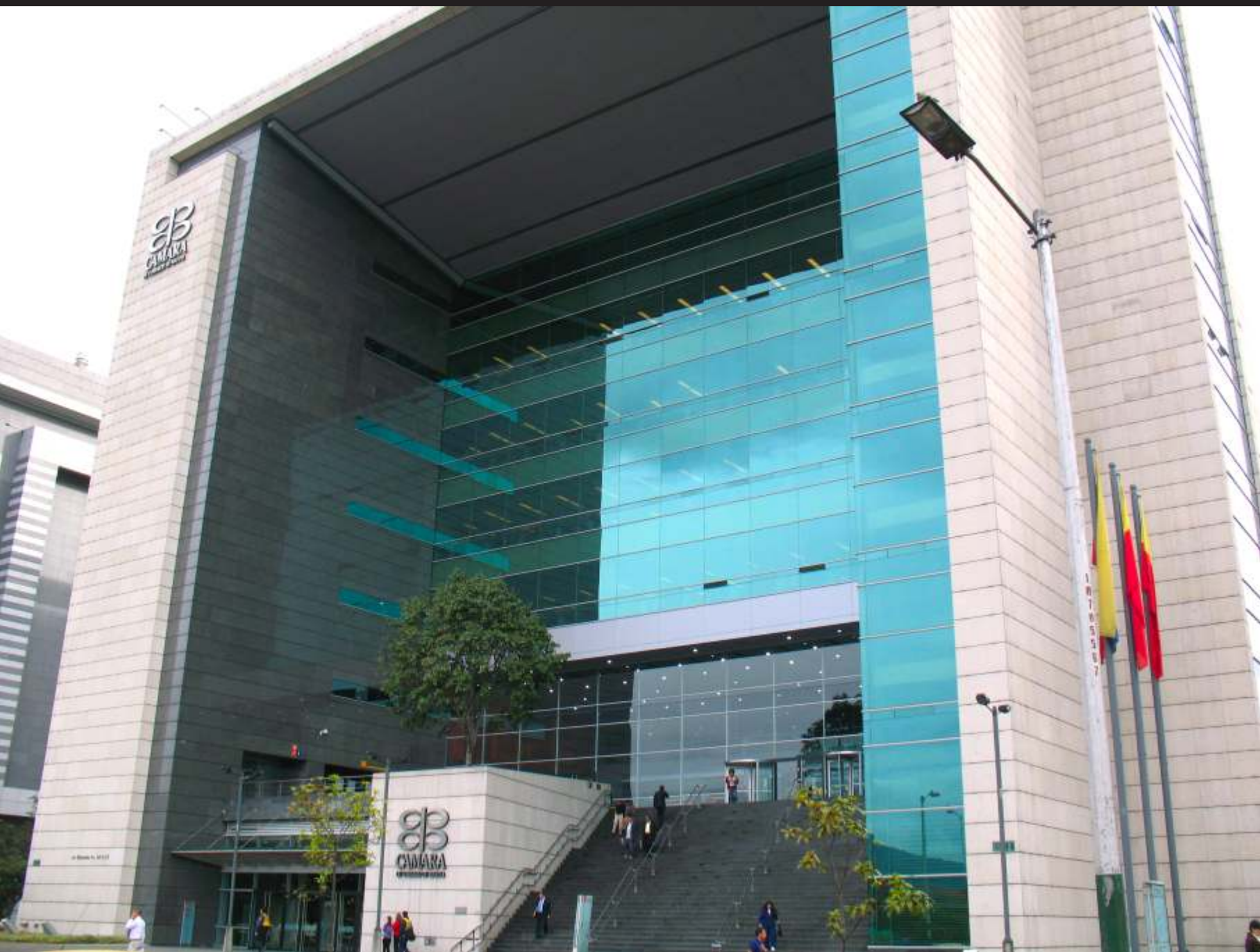
Centro Empresarial Salitre de la CCB