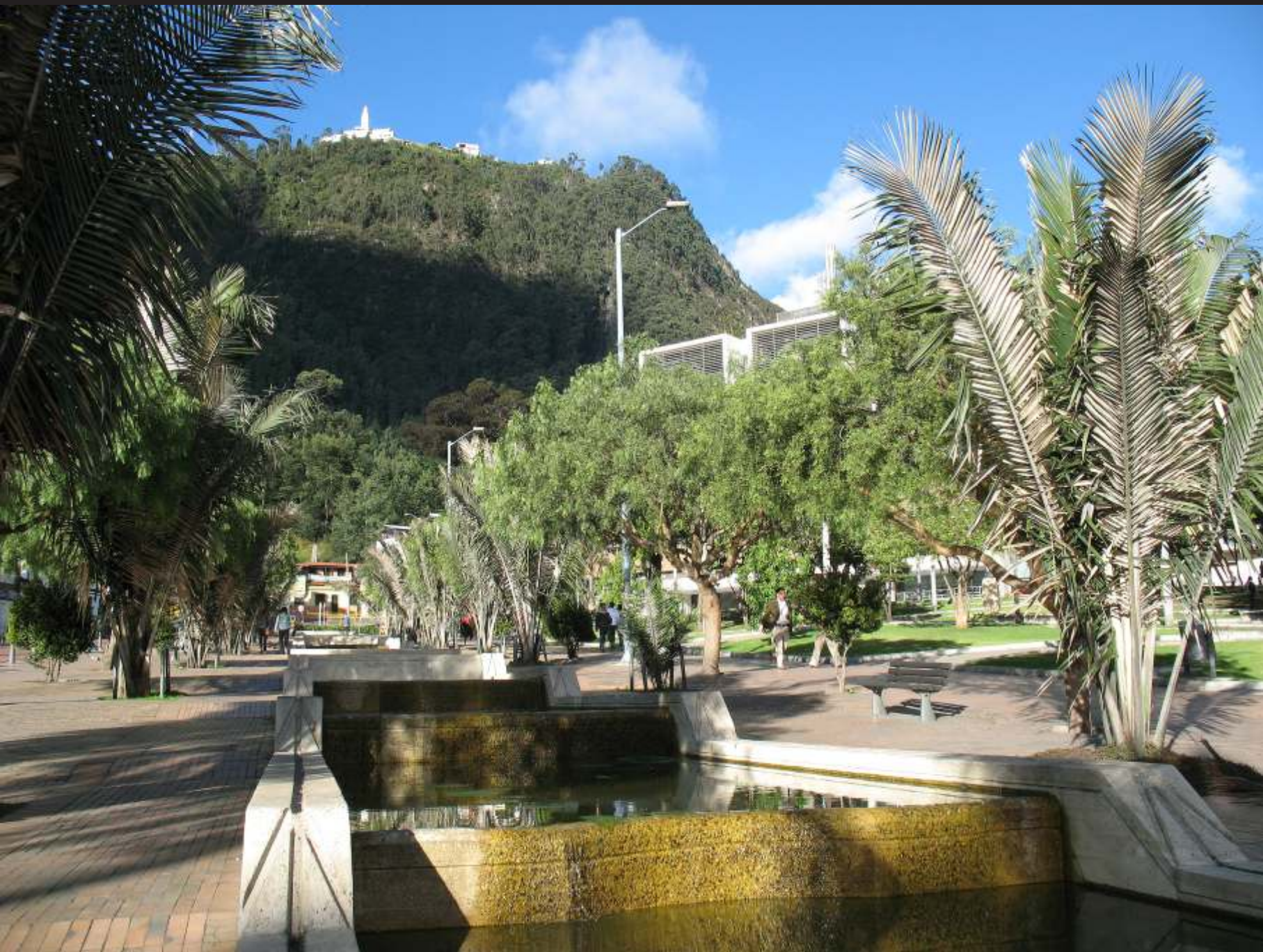
Eje Ambiental - Centro de Bogotá